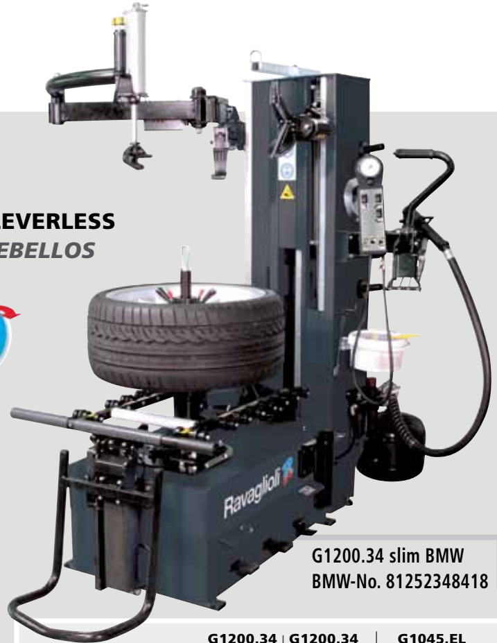
G1200.34 slim BMW BMW-No. 81252348418