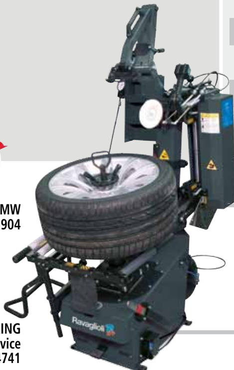
G1045.EL BMW BMW-No. 81252353904