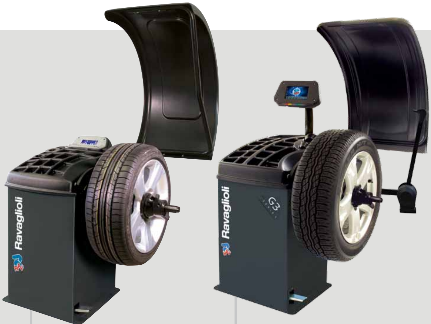
G2.124 BMW BMW-No. 8122151690 2 D wheel balancer. 2 D Wuchtmaschine.

SW-geführter Wuchtvorgang. Bedienerfreundliche Multifunktionstasten für die Steuerbefehle führen den Bediener in die jeweilige Wuchtvorgänge: die Tastfunktionen ändern sich je nach Gebrauch, sind am Display mittels grafischer Abbildungen dargestellt und sind dadurch leicht verständlich. Ein Gehäuse schützt das grafische Display vor Stöße. Modernes und praktisches Design.