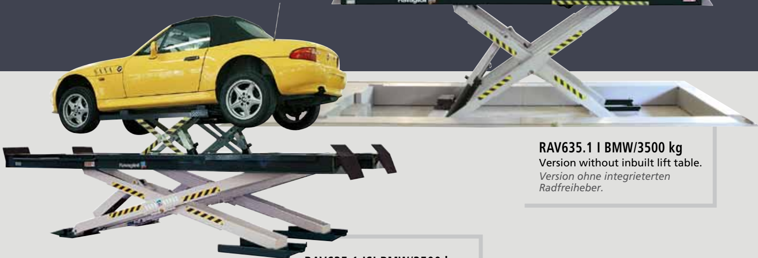
RAV635.1 | BMW/3500 kg Version without inbuilt lift table. Version ohne integrierten Radfreiheber.