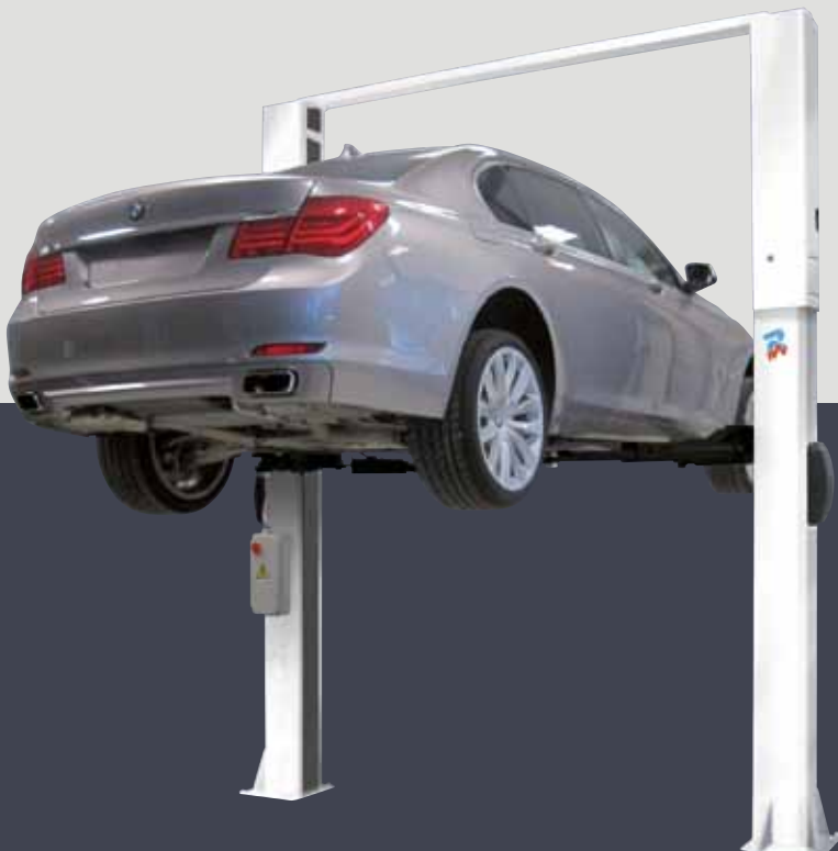
KPH 370.32R BMW/3200 kg BMW-No. 81222336483

Three - stage short arms for asymmetric lifting of large vehicles. Min. pad height 90 mm.