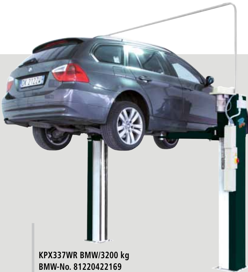
KPX337WR BMW/3200 kg BMW-No. 81220422169

Sämtliche Hebebühnen tragen die CE-Kennzeichnung und erfüllen die Anforderungen strenger Baunormen zur Gewährleistung der absoluten Betriebssicherheit.