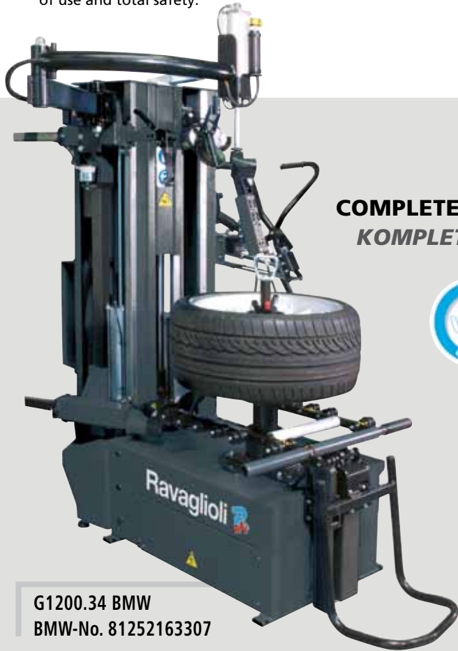
G1200.34 BMW BMW-No. 81252163307

Diese Reifenmontiermaschinen sind sowohl für den Einsatz auf normalen Felgen als auch auf Leichtmetallfelgen geeignet und garantieren schnelle Arbeit, bedienerfreundliche Anwendung und komplette Sicherheit.